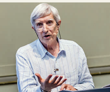
Der Gesundheitsökonom und Professor für Sozialepidemiologie Richard Wilkinson sprach über Status, Armut und gesellschaftliche Folgen von Ungleichheit.