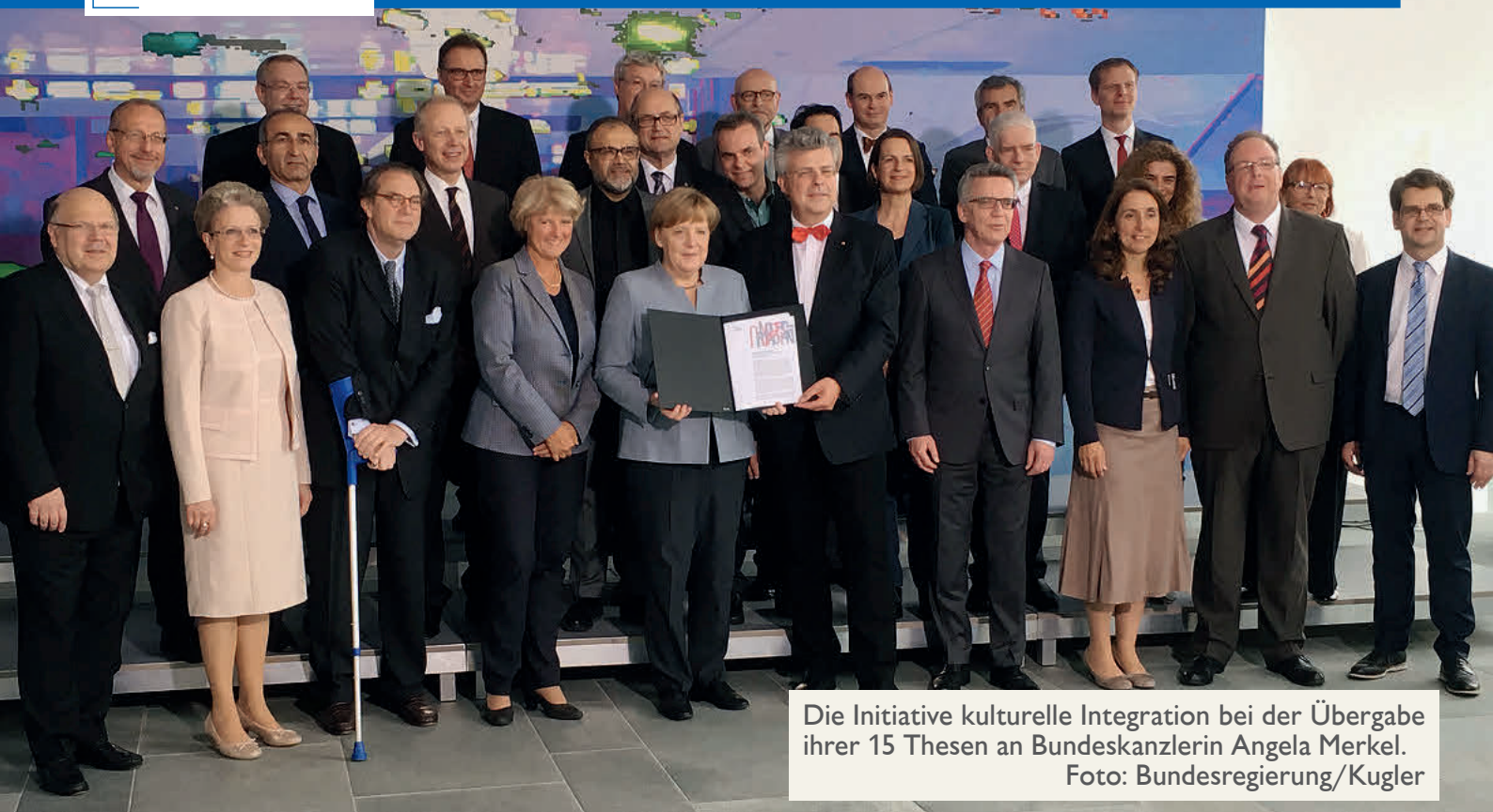
Die Initiative kulturelle Integration bei der Übergabe ihrer 15 Thesen an Bundeskanzlerin Angela Merkel.