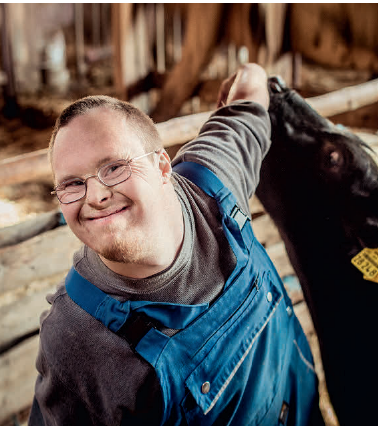
Bauhof Stütensen Sozialtherapeutische Gemeinschaft e.V.