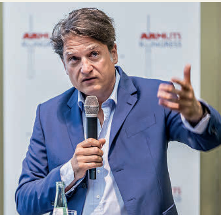
Jakob Augstein, Verleger der Zeitung „Der Freitag“, beschäftigte sich in seiner Rede mit Rechtspopulismus und Ungleichheit.