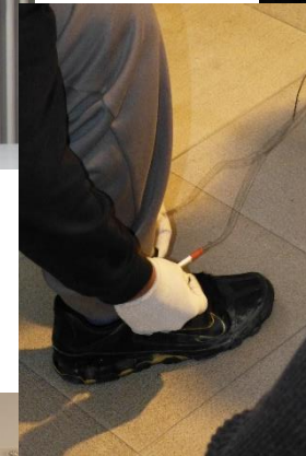
vkm e.V. Menschen mit Einschränkungen