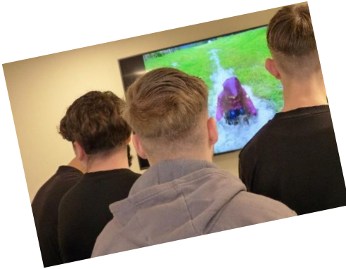
Kinder und Jugendhilfe Outlaw gGmbH