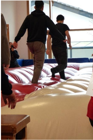
Movere e.V. Psychomotorik