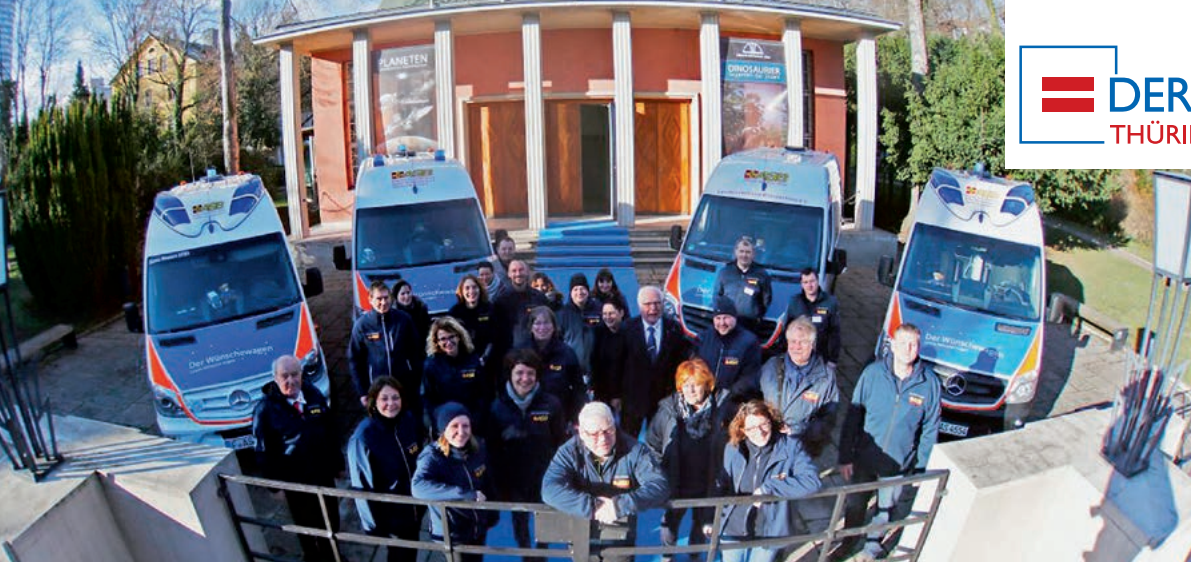
Sie erfüllen Herzenswünsche: Das Team des Wunschewagens des ASB Jena