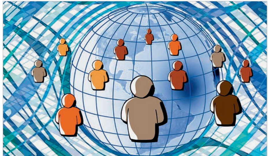
Große Herausforderungen liegen in der Digitalisierung

Technologie-Experten haben einmal einen Blick in die Zukunft gewagt und Prognosen aufgestellt. Danach wird es 2021 Kundenberatungs-Roboter in den Apotheken geben, zwei Jahre später werden schon zehn Prozent aller Brillen und Kontaktlinsen mit dem Internet verbunden sein. 2025 werden unter die Haut implantierte Mobiltelefone Standard sein und 2026 wird der erste Computer einen Sitz im Aufsichtsrat eines Unternehmens erhalten.