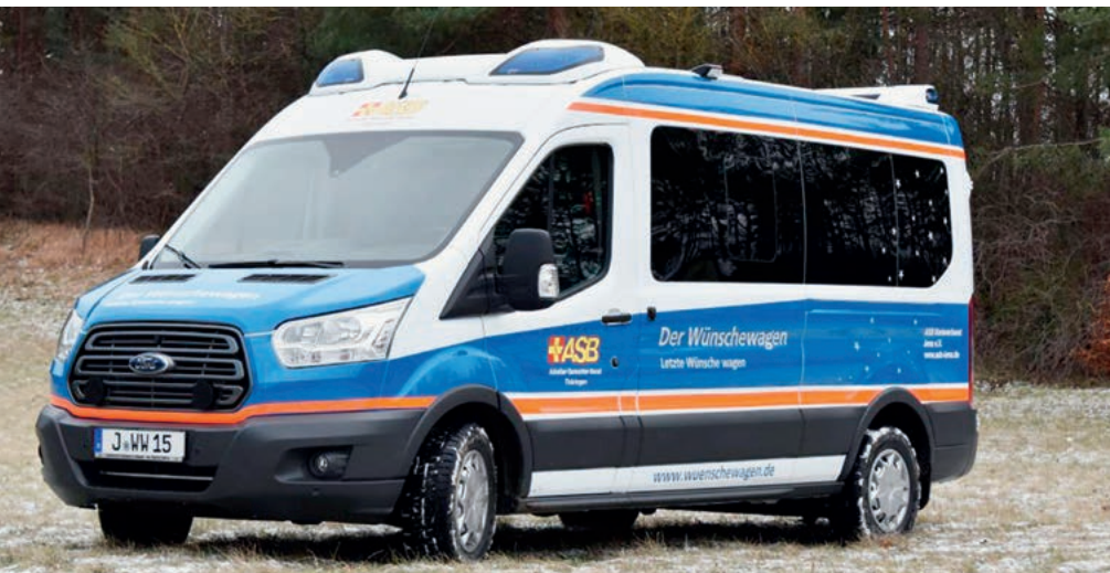
Sieht auf den ersten Blick aus wie ein normaler Krankentransportwagen: Der Wünschewagen des ASB

ehrenamtlichen Helfern, Eigenmitteln und Spenden.