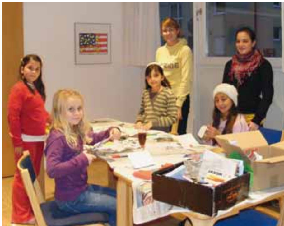
Für Jungs gab's in Eching schon genügend Angebote, für Mädchen waren sie dünn gesät. In Kooperation mit der Nachbarschaftshilfe entstand der „girl's club“.