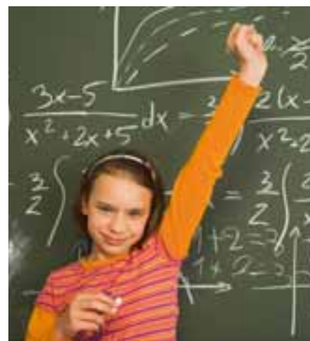
Damit Schule Kinder stark macht

len abrechnen, kein Schulgeld verlangen. Für Kinder mit besonderem Förderbedarf – wie etwa Kinder mit Behinderungen – muss es Zuschläge staatlicherseits geben.“