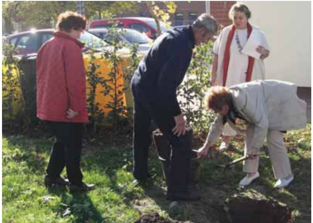
Grabungsarbeiten für die Pflanzaktion im Generationengarten des Mehrgenerationenhauses Dummerstorf bei Rostock