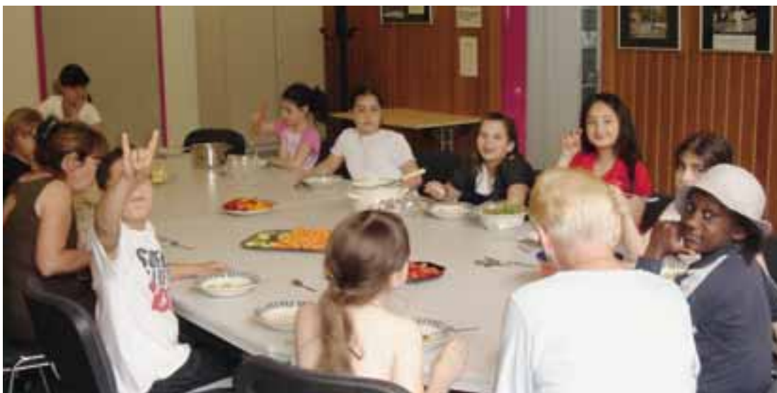
Gesundes Mittagessen für „Bärenstarke Kinder“

In Gelsenkirchen-Horst bietet das Gesundheitshaus seit einiger Zeit auch ein Projekt zum Thema Ernährung und Bewegung an, das „KINDERLEICHT-Quartier“. Es ist aus einem Wettbewerb des Bundesverbraucherministeriums entstanden und hat das Ziel, das Ernäh-