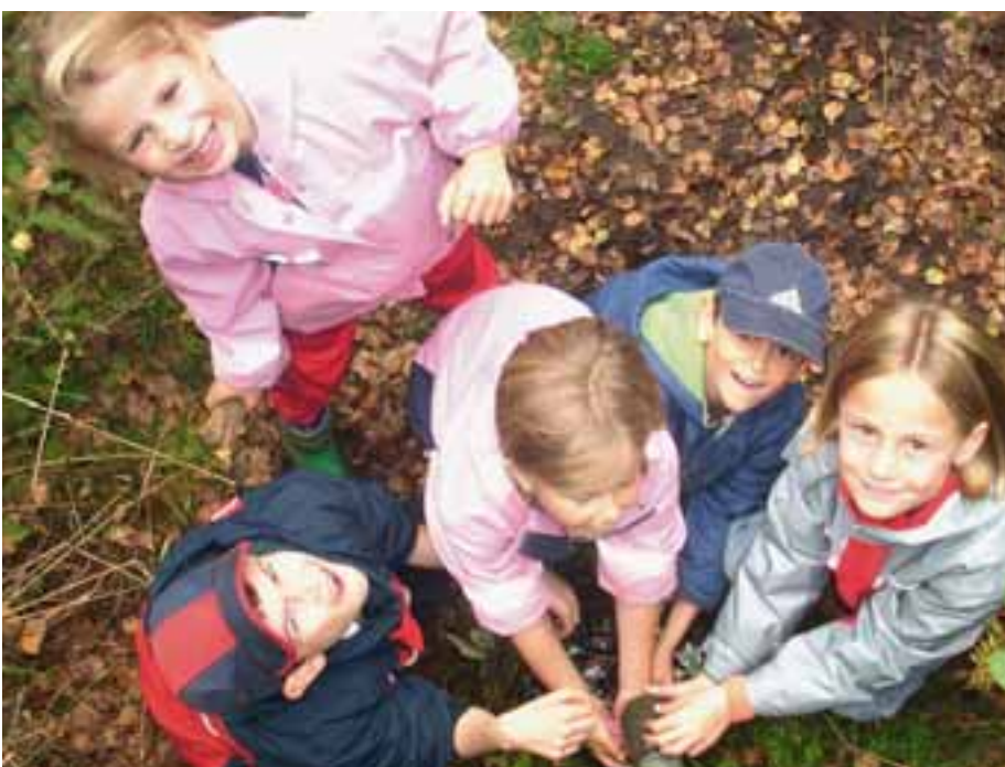
Kreativ unterm Walddach – da werden die Ferien garantiert nicht langweilig.

Das FNZ bietet ferner in seinem Café und seiner Großküche Beschäftigungs- und Qualifizierungsmaßnahmen für langzeitarbeitslose Frauen. Ein Jahr lang werden derzeit zwölf Teilnehmerinnen im Alter zwischen 25 und 56 Jahren, viele davon alleinerziehend, in Service und Hauswirtschaft ausgebildet. An den Herden wird nämlich nicht nur der Mittagstisch für das Café zubereitet, sondern auch gesunde Kost für Krippen und Kindergärten, 170 bis 200 Essen täglich. Die Förderung durch die