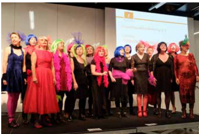
Abb.: Der Berliner Frauenchor „Judiths Krise“ sorgte für das feministische Rahmenprogramm.

Die Veranstaltung wurde durch die Glücksspirale gefördert.