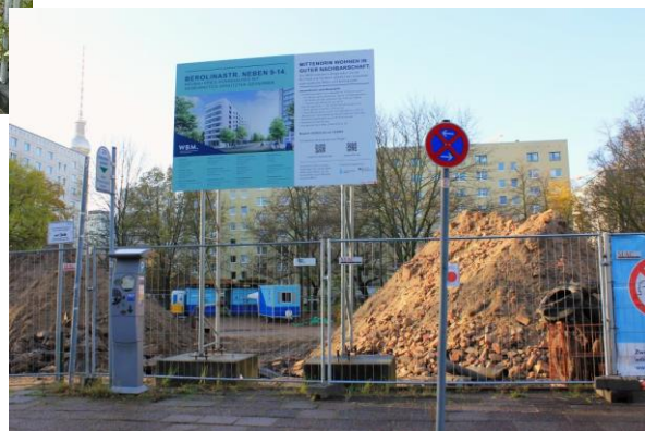
12. Dez. 2023